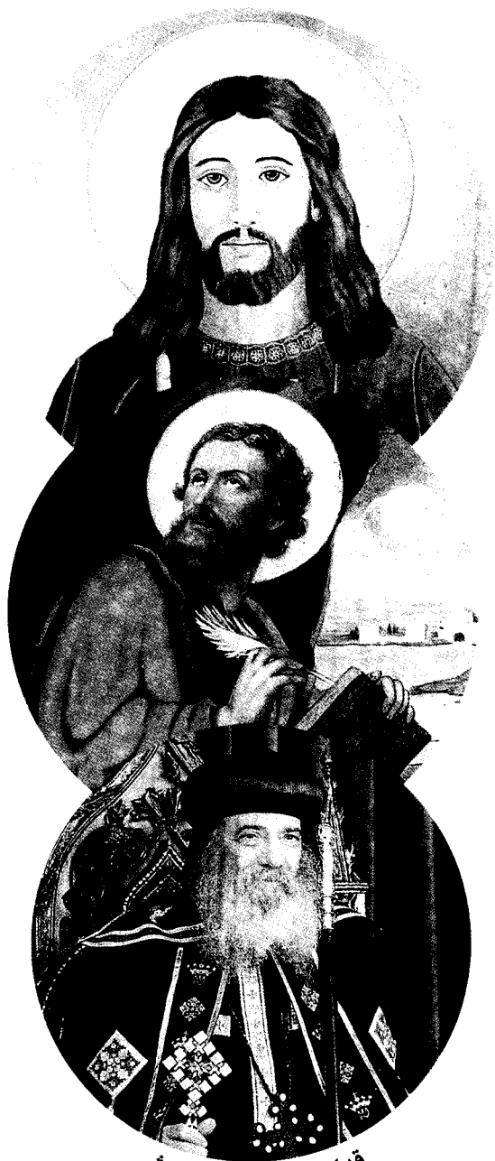
قداسة البابا شنودة الثالث بابا الإسكندرية وبطريك الكرازة المرقسية