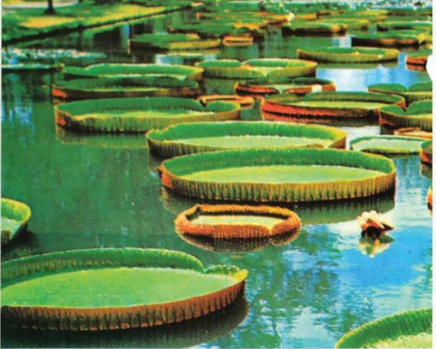
★ إحدى البحيرات التي تنمو فيها نباتات مائية، جميلة الشكل، وتادرة الوجود ★

بعض أزهارها مكونة من سبعة أعضاء . وهم لا يعملون في مجال الدعوة الإسلامية ، وإنما يعملون بالتدريس في بعض المدارس .