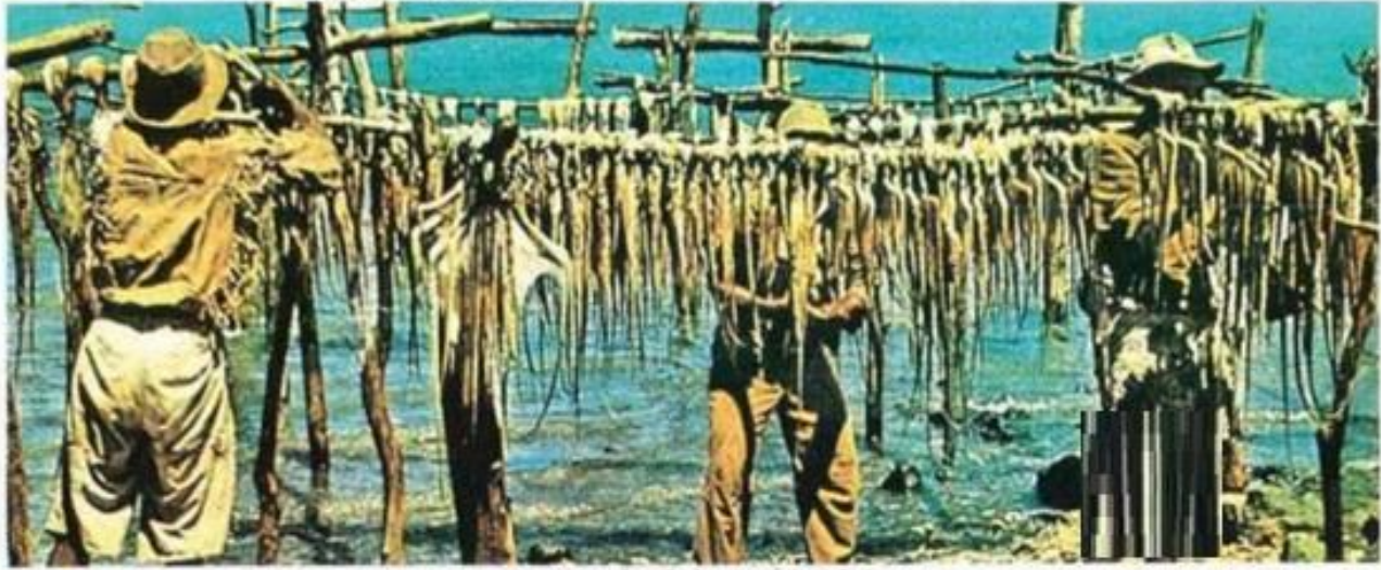
★ الصيادون في حياتهم اليومية .. في موريشيوس ★

حضرت إلى موريشيوس وجذبت المشايخ مهيباً لاهتقاق الإسلام بمجرد التعرف على حقائق الدين الإسلامي . ويمكن أن يكسب الإسلام أعداداً كثيرة من معتنقي العقائد الأخرى . وظيف الدكتور علي سلامة قائلاً : « إن الدعوة إلى الإسلام ، ليست بمجرد وعظ وتصالح ، بل عمل وقناعة . فلما أحمل معي الأدوية التي أعالج بها المرضى وأتلى القرآن الكريم وأقيم الصلاة وسط التجمعات الوثنية . فالخدمة والوعظة هما أساس نجاح الدعوة الإسلامية في أي مكان » .