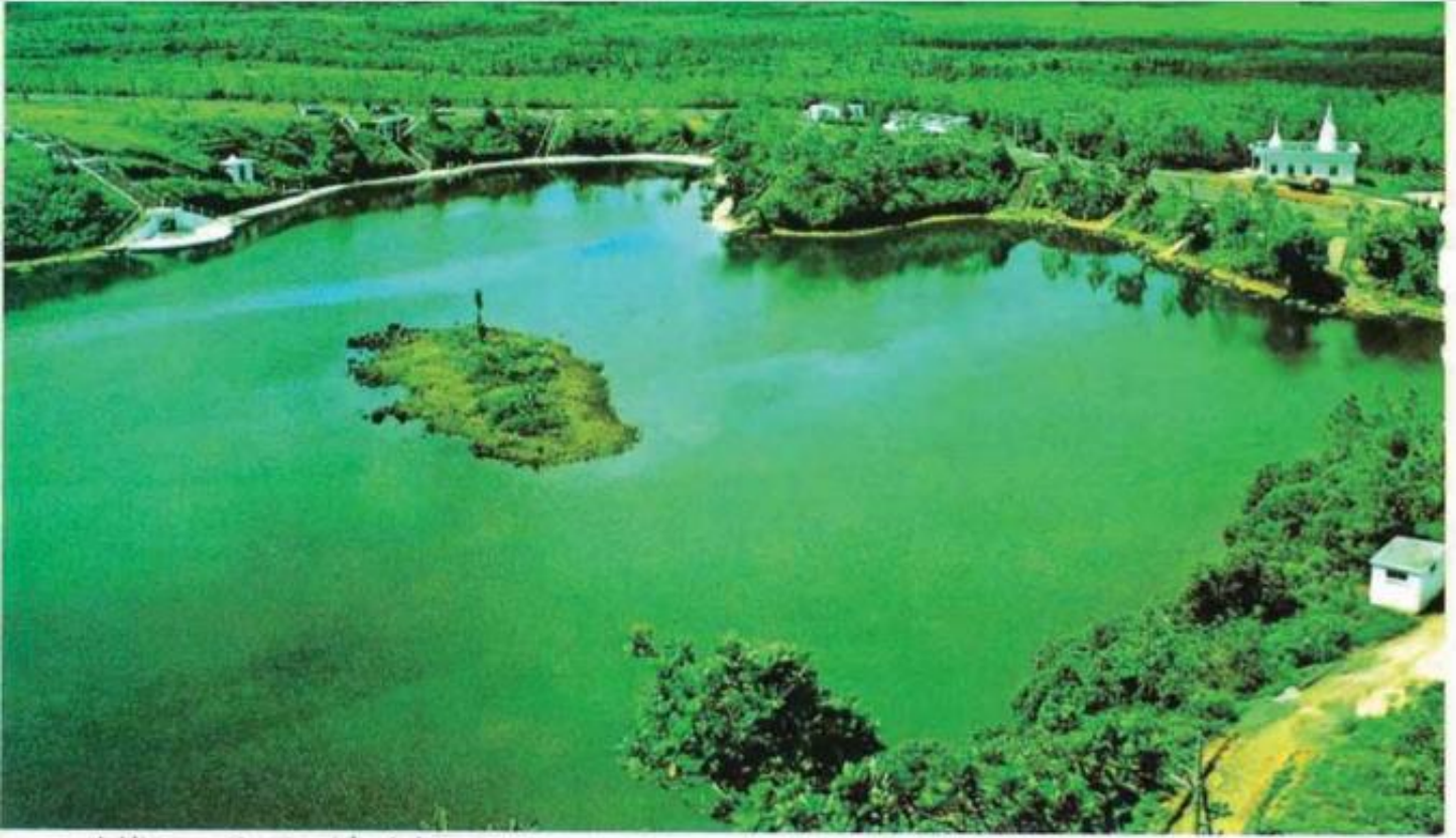
★ بحيرة طبيعية .. لجعل موريشيوس بمن .. جزيرة الجنة ★