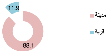
شكل (٤): توزع أفراد العينة حسب المنطقة:

تمثلت أعلى نسبة من مجموع أفراد عينة الدراسة بحسب المنطقة السكنية في الدعوة الذين يزاولون عملهم بالمدينة، حيث بلغ عددهم (١١١) داعية، بنسبة (٨٨,١)٪، وكانت أقل نسبة لدى الدعاة الذين يشتغلون بالقرى، حيث بلغ عددهم (١٥) داعية، بنسبة مئوية (٩,١١)٪ من مجموع أفراد العينة.