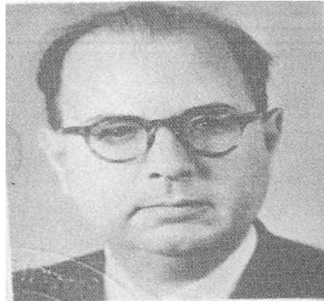
المقاوم عبد الكبير الفاسي 2