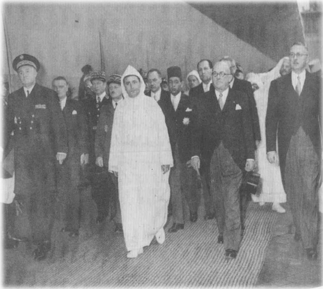
الزيارة الرسمية الملكية الى فرنسا في أكتوبر 1950م: الملك وولي العهد وفانسان أوريول رئيس الجمهورية وروني بليفن رئيس الوزراء 1