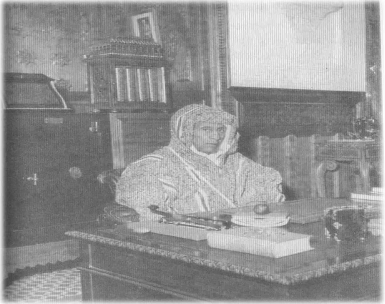
الباشا الكلاوي في مكتبه 1