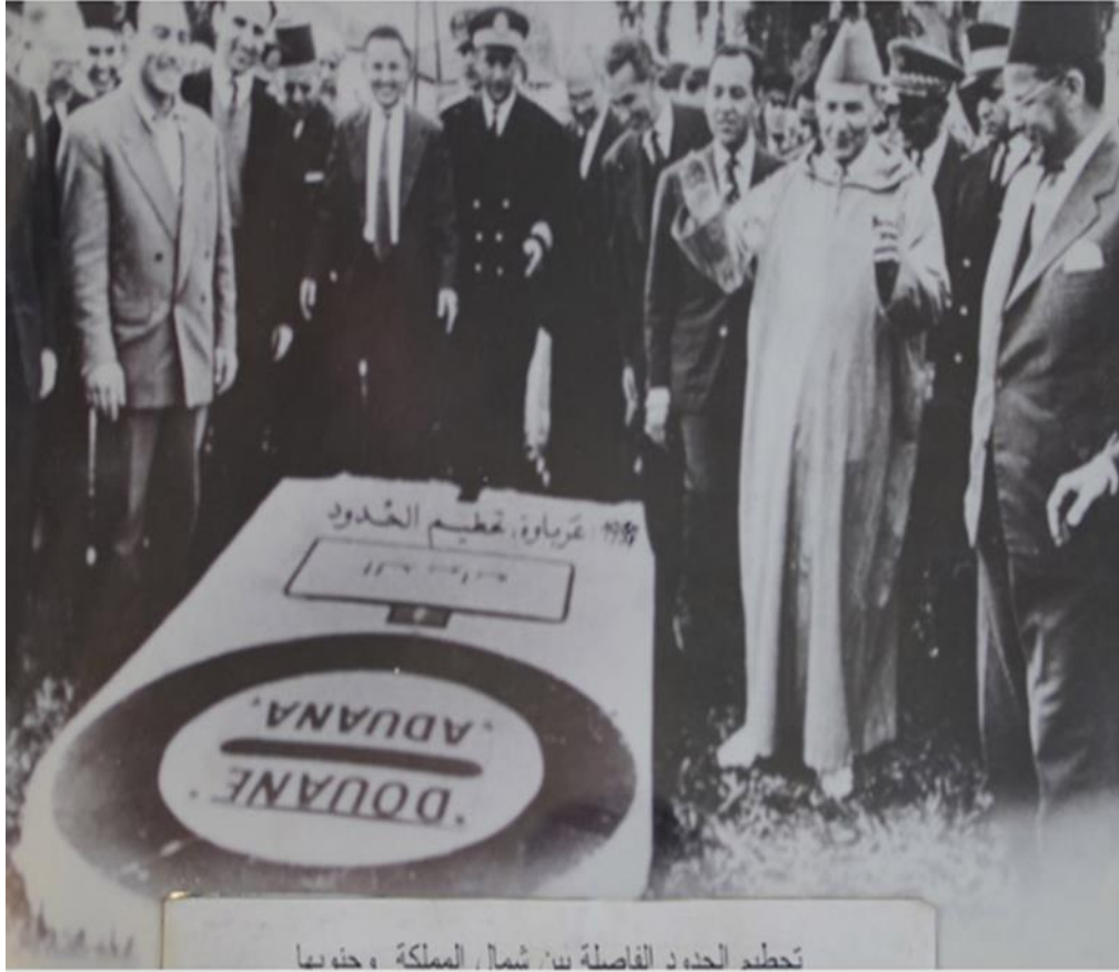
تخطيط الحدود الفاصلة بين شمال المملكة وجنوبها 1