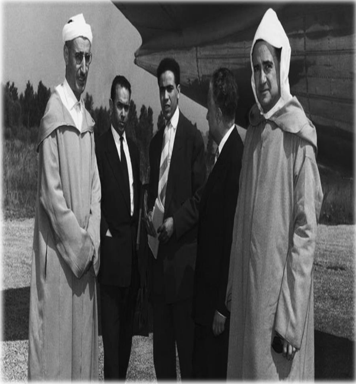
بعض المشاركين في مفاوضات إكس لبيان 1