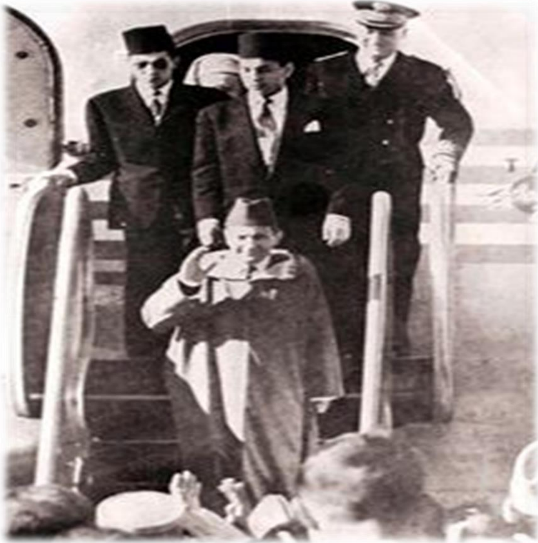
عودة الملك محمد الخامس من منفاه 16 جوان 1953م 1