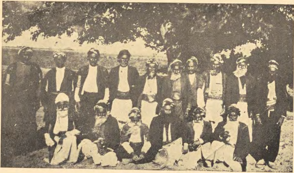
بعض شيوخ وروساء اليزيدية في منطقة حلب