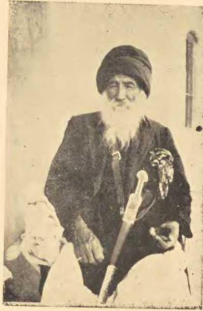
حمو شرو كبير اليزيدية في بلاد سنجار