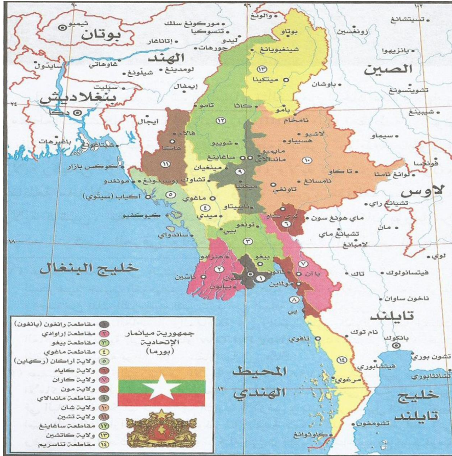
الخريطة الجغرافية لدولة بورما (١) .