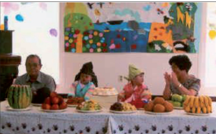
Geon Christian Children Home

وهو من أخطر منظماتهم، مدرسة داخلية للأطفال