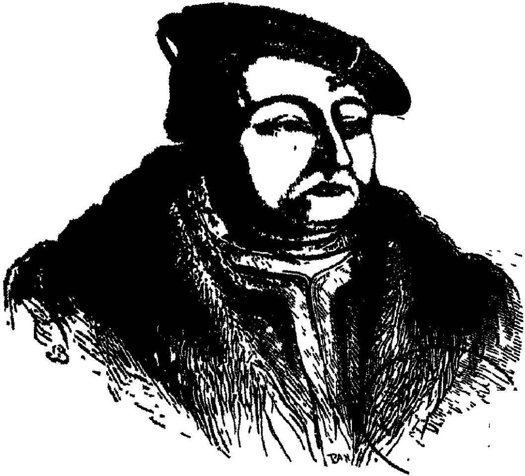
صورة لوتير صورها يوحنا فليبيون معاين

قال لوتير في مذاكراتو وجه ٣٥ : عندي تلتة كلاب شريين وهي الكند (كفران النعمة) ، والكبريا ، والحسد . من عصته احسبت عصه . ومزاجي يتغزر بالفضب . وعقلي يشخذ غرره بالكيد . وقربيجتي تجود عند العيظ