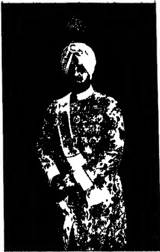
H H Maharaj Dhiraj Sir Phupinder Singh Bahadur Maharajah Saheb of Patiala State

He is 45 years old and reigns over an extensive province in Punjab. The inhabitants of Patiala State are about one million in number.