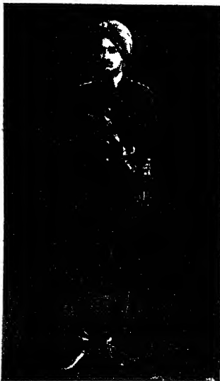
مضرة صاحب السمور الأُمير شري ناد مندر سنج بهادر صاحب ولي عهد اماره ذالا و لمع امانته والعديس من عمره السعد