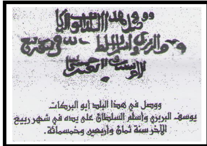
التازي، المرجع السابق، ص ١٣.

ملحق رقم (١): النقش كتب على الديبجات في أعقاب زيارة ابي البركات البربري