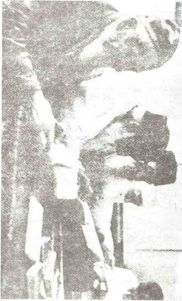
يهود من العالم العربي

ويحاول كون أن يجعل من اليهود طوال الرءوس من السفارديم وبعض الشرقيين وحدة اثنولوجية Ethnic Unit قائمة بذاتها ، قد تتباين فيما بينها من منطقة الى منطقة ، ولكنها بعامة تتباين أكثر مع السكان المحيطين . وبالمثل يصور اليهود الأشكناز ومعهم بقية الشرقيين على أنهم وحدة اثنولوجية أخرى . ومع ذلك فهو يعترف بأن كل نوع أو سلالة جنسية معروفة في أوروبا يمكن بسهولة أن تلتقط من مابين يهود القارة ، وأن اغلب اليهود يمثلون خليطا بطريقة أو بأخرى بين عديد من تلك الأنواع والسلالات . وكذلك يضيف أن من السهل جدا أن تلتقط من بين يهود روسيا أفرادا