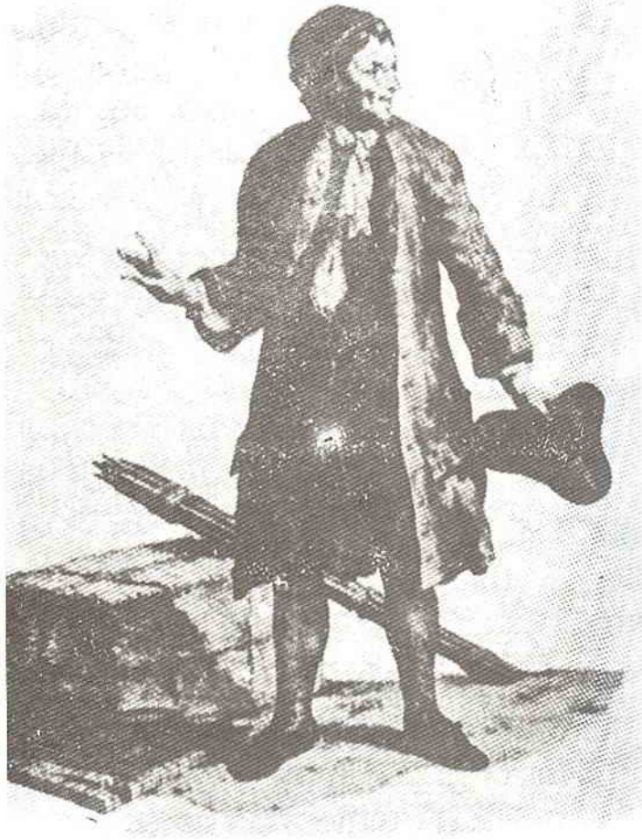
شلمة مصر الأول

مدن كبرى بالدقة ، ثم هن الى ذلك سكان عواصم بالترفضيل والامتياز . وأنت حين تتكلم عن يهود دولة ما فأنت تتكلم فى الحقيقة عن يهود العاصمة ومدينة أو اثنتين الى جوارها . وهذه حقيقة طاغية وأبدية طوال تاريخ اليهود قديما كان أو حديثا ولاتتبلور كما تتبلور فى وقتنا هذا . والأمثلة تغنى عن الحصر ، ولعل أوضحها فى الذهن المثال الأمريكى .