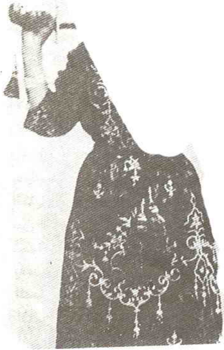
راقصة يهودية من تركيا

وبوجه عام فنحن نجد منذ بداية التاريخ أن الرفض للزواج المختلط بين اليهود والجنثيل لم يكن قط جنسيا بل دينيا ، بحيث ينتهى إذا تحول الجنثيل الى اليهودية ، والواقع أنه فى أيام اليهودية الأولى لم يكن الزواج من غير المؤمنين ممنوعا أبدا ، كما حدث فيما بعد . هكذا يذكر المؤرخ جوزيفوس أن يهود انطاكية نجحوا فى تحويل الكثيرين الى عقيدتهم وأدخلوهم مجتمعهم . وقد حدث عدد كبير للغاية من التحول