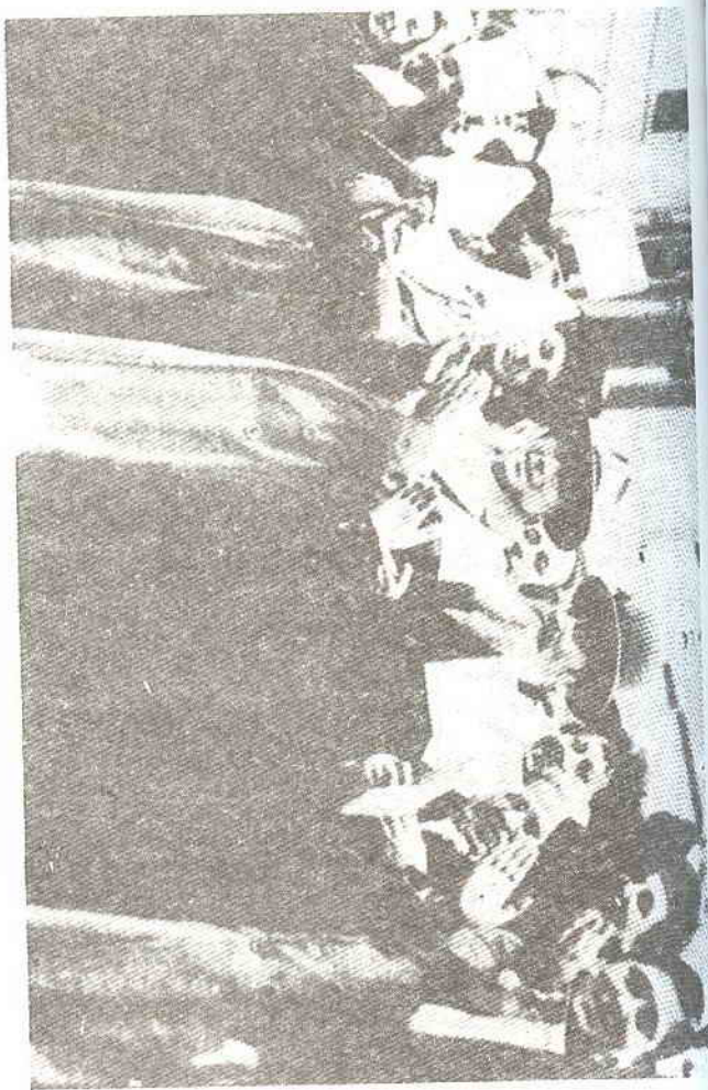
مجموعة من يهود الأرجنتين

والثابت أن التحول والاختلاط كانا من المظاهر المتفشية قبل العصر المسيحى مباشرة وفى قرونه الاولى . فحين تشبت اليهود فى العالم المتوسطى وجدوا أنفسهم ازاء اختيارين : إما أن يرتدوا وثنيين كجيرانهم الجدد ، وإما أن يحتفظوا بديانتهم . وهناك - كما يقول بيرجل - " أصبح الكثيرون ، ربما الاغلبية ، وثنيين ، وذلك لأن من بين القبائل الاثنتى عشرة عشرا « مفقودة » كما تحدثنا الروايات " . وفى حالة التحول كان اليهود يفقدون كيانهم الجنى جنبا الى جنب مع كيانهم الدينى ، ويصبحون جزءا لا يتميز عن الأمة التى اقاموا بينها . أما إذا ظلوا على يهوديتهم ، فانها اذن العزلة الاجتماعية ، ومن ثم فلا تزواج إلا إذا