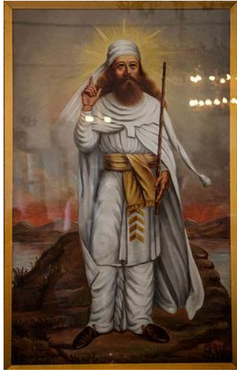
صورة للتشهد الزرادشتي الثنوي 83

ومما يُثبت ذلك أيضا بأن الزرادشتيين تظاهروا بالتوحيد وأبطنوا عقيدة الشرك والثنوية هو أنهم بعدما حرفوا كتابهم ودينهم وترათهم حسب الدعوة البهافرديية وجدناهم اختلفوا صورة وهمية لزرادشت -الذي ينتمون إليه زورا وبهتاناً 81 - وصوّروه ممثلاً لشعار دينهم لباساً وحزاماً وعصى ورفعا لليد . فصوّروه رافعا يده اليمنى مطبقا لأصابعه إلا السبابة والإبهام، والسبابة هي الأولى ظهورا والأكثر بروزا فتوحي للمشاهد بالتوحيد من الوهلة الأولى، لكنها تنقضه برفع الإبهام، لتصبح يده تمثل العقيدة الثنوية: الإلهان أهورامزدا وأهريمن ، التي هي أصل الديانة الزرادشتية كما هي في الأفسستا والشواهد الأثرية والتاريخية 82 . فهم بتلك الصورة سجلوا تاريخهم التحريفي ، وهي اعتراف منهم بالتعدد والتحريف معا. لأن التوحيد الحقيقي لا يُرمز له بأصبعين مستقيمين، هما: السبابة والإبهام، وإنما يُرمز له بأصبع واحد مستقيم هو السبابة فقط ، ويكون الإبهام مع باقي الأصابع مُطبّقا ، كما في التشهد الإسلامي المعبر عن التوحيد، وكما هو واضح في الصورتين المقارنتين أدناه بين التوحيد والثنوية.