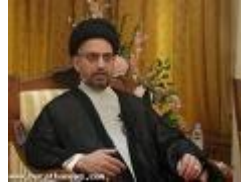
عبد العزيز الحكيم