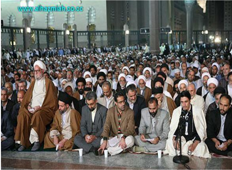
تجمع للشيعة الإيراني في ساحة الحرم النبوي - قرب البقيع

القوي لإنهاء الأزمة؛ وذلك على يد الأمير عبد الله الفيصل . وفي عام (١٤١٣ هـ) قاموا بثورة أخرى عند الثانوية الصناعية في المدينة، وتصدى لهم هذه المرة المواطنون من أهل السنة؛ فقمعهم بالقوة حتى تدخلت قوات الأمن لفض الاشتباكات، وحصل فيها إصابات وفوضى كبيرة. كما أنهم دعوا إلى تدويل مقبرة البقيع، ومن ثم وسعوا هذا إلى المطالبة بتدويل الإشراف على الحرمين الشريفين، وهذا يناقض بشكل صارخ احترامهم لبلدهم، ويطعن في وطنيتهم بشكل لا لبس فيه! وذلك جرياً على قاعدة: «ما لي فهو لي، وما لك فهو مشترك بيننا»!!