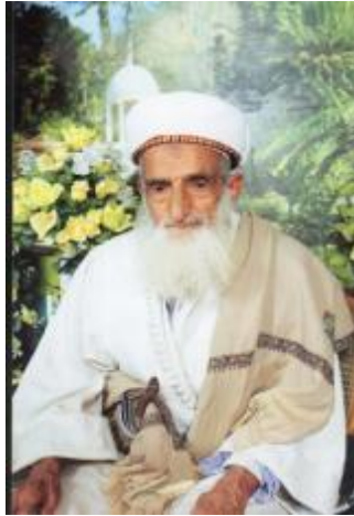
حمود بن عباس المؤيد

K مركز ومسجد النهرين: الذي يقع في منطقة صنعاء القديمة، ويستمد أهميته من شخصية إمام المسجد حمود بن عباس المؤيد؛ مفتي الجمهورية، وهو رجل كبير السن يستغل الشيعة اسمه في دعوتهم؛ بسبب قبول الناس له.