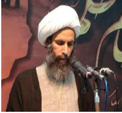
نمر باقر النمر

ففي سنة (٢٠٠٨م) تقدم الشيخ نمر النمر بعريضة شيعية متطرفة؛ كشفت عن توسع طموحات شيعة السعودية؛ بسبب الأجواء المساندة في المنطقة للشيعية، وقد شملت عريضة النمر المطالب التالية (١) :