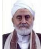
إبراهيم بن محمد الوزير

وبالرغم من الانتشار المحدود لهذه الصحف، وقلة قرائها؛ إلا أنها تلعب دورًا في الترويج لعقائد الشيعة، ومهاجمة هيئات علماء أهل السنة؛ على اختلاف تياراتهم؛ كالشيخ عبد المجيد الزنداني، والشيخ عبد الوهاب الديلمي، والشيخ حسين بن شعيب، والوقوف في صف العلمانيين، والرّد على ما يكتب في صحف ومجلات التيارات السنية؛ كالسلفية، وجماعة الإخوان المسلمين.