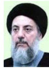
محمد باقر الحكيم