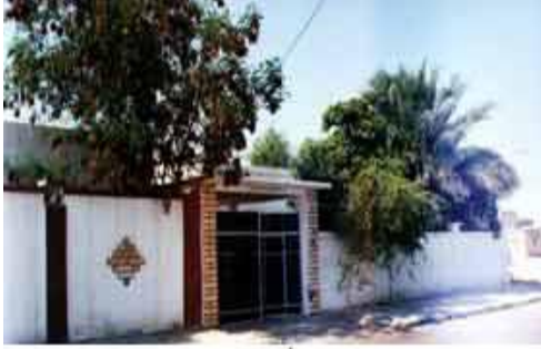
حسينية الرسول الأعظم - قسم النساء