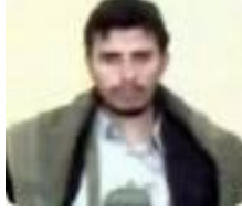
عبد الملك الحوثي

شن الحوثيون حركة التمرد للاعتراض على شرعية الرئيس علي عبد الله صالح، ورفض نظام الحكم الجمهوري، والمطالبة بنظام الإمامة الزيدية الذي كان موجوداً حتى عام (١٩٦٢م).