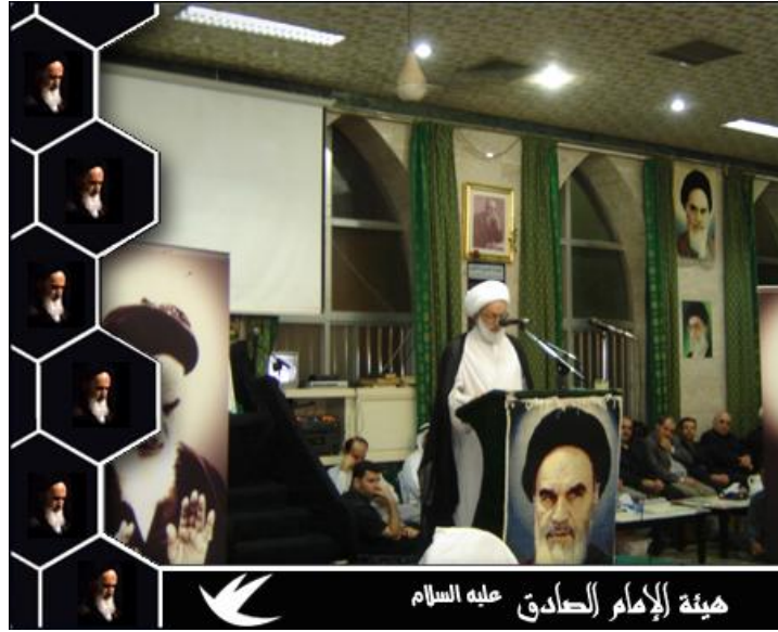
زعيم شيعة البحرين تحيط به صور الخميني في أحد خطابه

٢- أن التجمعات الشيعية في العالم، وفي دول الخليج - خاصة - تتأثر سلباً وإيجاباً بعلاقات بلدانهم مع إيران، خاصة وأن غالب هذه الجاليات تستخدم من قبل إيران لتنفيذ مخططاتها في هذا البلد أو ذاك. ولقد كانت العلاقات الإيرانية البحرينية مثلاً للتوتر والشكوك في معظم فتراتهما، بسبب أطماع إيران في هذه الجزيرة، واعتبارها جزءاً من أراضيها، وعدم الاعتراف بجوازات السفر التي كانت تصدرها البحرين، واعتبارها محافظة إيرانية، بل واحتسابها من إرث مملكة فارس؛ التي ورثتها إيران اليوم. ولا يقتصر النهج العدائي هذا على جزيرة البحرين، بل قامت إيران باحتلال ثلاث جزر تتبع دولة الإمارات العربية المتحدة هي: (طنب الكبرى، وطنب الصغرى، وأبو موسى) سنة ١٩٧١، وما زالت إيران تحتلها حتى اليوم، وترفض التخلي عنها، وتوعد وجودها فيها.