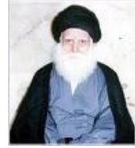
محمد صادق الصدر

وهو تيار كبير، وشبابي؛ يفتقد للتجانس، وللمراجع، والمرشدين، ويتركز في مدينة الثورة (مدينة الصدر حاليًا).