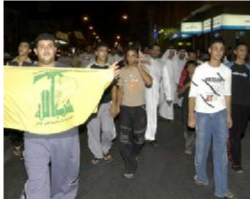
شيعة السعودية يتظاهرون دعماً لحزب الله