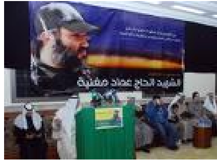
حفل تأبين مغنية