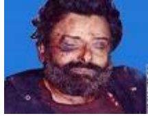
جثة حسين الحوثي

يعتبر التمرد الذي قاده الحوثيون بدءاً من يونيو/ حزيران سنة ٢٠٠٤م أحد مظاهر الاختراق الإثني عشري للزيدية في اليمن. ففي ذلك العام: قاد حسين بدر الدين الحوثي تمرداً ضد السلطات، في منطقة صعدة بشمال اليمن، واستمر لمدة (٣) أشهر، قتل فيه أكثر من (٤٠٠) شخص، وقتل فيه حسين الحوثي.