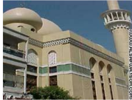
مسجد الإمام علي بدبي