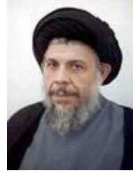
محمد باقر الصدر

وقد كان حزب الدعوة - في بداياته - يضم بعض اللبنانيين مثل: السيد محمد حسين فضل الله، ومهدي شمس الدين؛ الذين نقلوا تجربة الحزب للبنان (٢) ، وقد كان محمد باقر الصدر هو المرجع للحزب؛ حتى بعد خروجه منه، وقد تعرض الحزب في مسيرته إلى عدد من الانشقاقات (٣) .