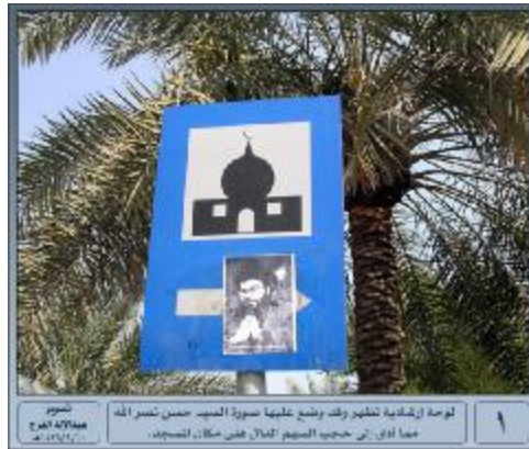
ملصقات شيعية على اللوحات الإرشادية في السعودية