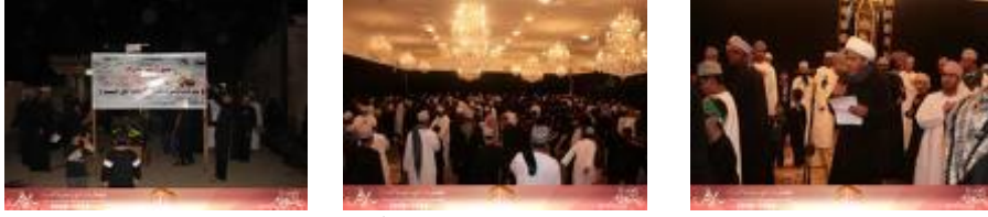
من طقوس عاشوراء في عُمان