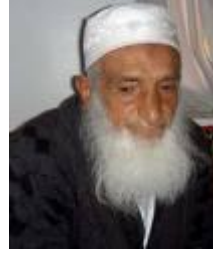
بدر الدين الحوثي

ويقول محمد بن إسماعيل الويسي - في معرض ترويجه للفكر الشيعي الإمامي -: «وأعظم مدرسة فلسفية توضح لنا الاقتصاد الإسلامي؛ بطرح واضح، وحقيقة لها جذور إسلامية صحيحة هي: مدرسة السيد محمد باقر الصدر - رحمه الله تعالى -؛ الذي أسدى للإسلام والأمة بل للبشرية خدمة قلّ نظيرها! والذي كان يمثل العلماء العاملين بحق، ولم يقتصر على علم جامد يقتصر على النجاسة والطهارة». ويقول: «فأنا أنصح كل من يريد تحرير فكره، ونضوج عقله أن يطلع على مؤلفات الشهيد محمد باقر الصدر وغيره من العلماء الواعين؛ الذين خدموا الإسلام بصدق لا بمنطق مذهبي متعصب، وبمنطق التكفير والتفسيق، فللمسلمين الحق بأن يفتخروا بعظماء كهؤلاء» (١) .