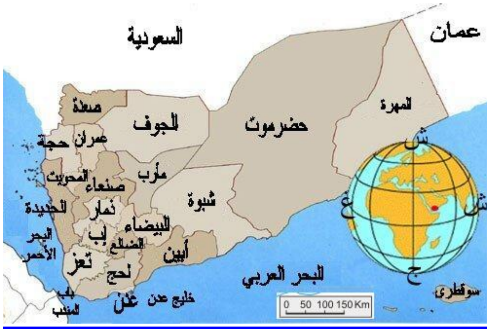
خارطة موقع محافظة صعدة