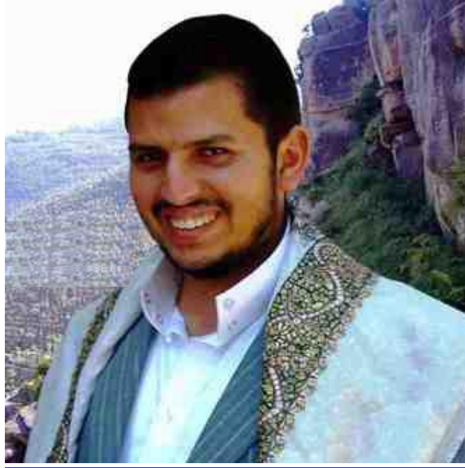
عبدالملك بن بدرالدين الحوثي