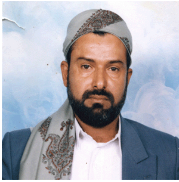
حسين بن بدرالدين الحوثي