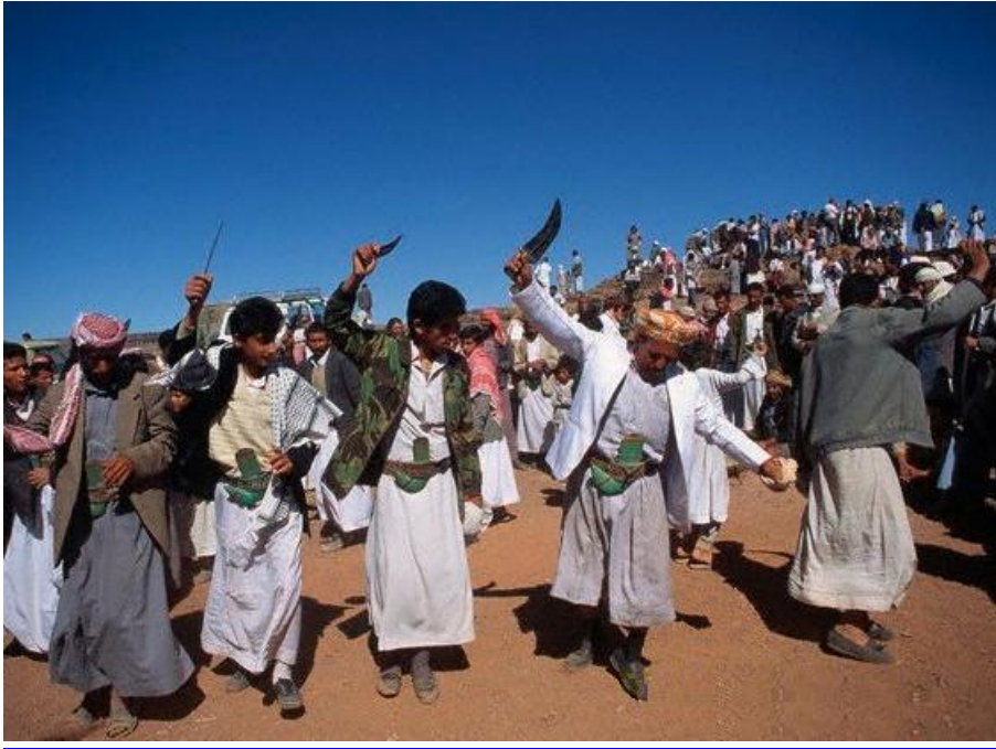
الاستعداد ليوم الغدير