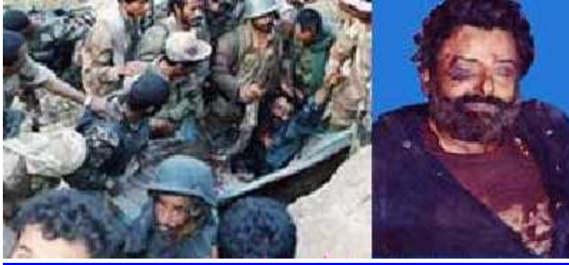
حسين بن بدرالدين الحوثي بعد مقتله في الحرب الأولى