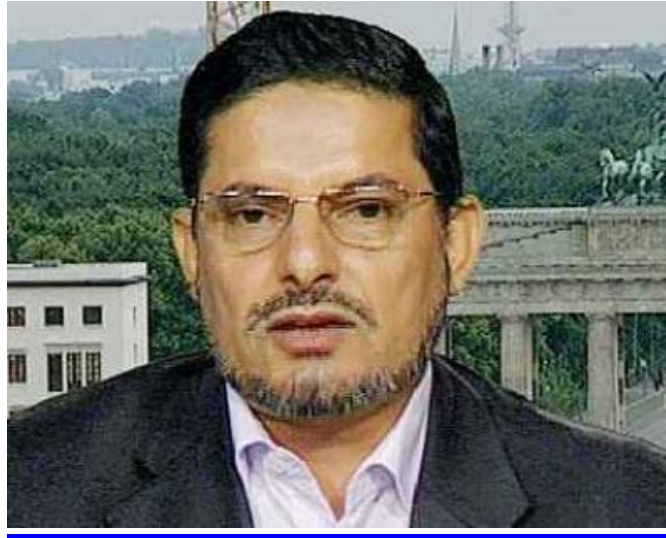
يحيى بن بدر الدين الحوثي