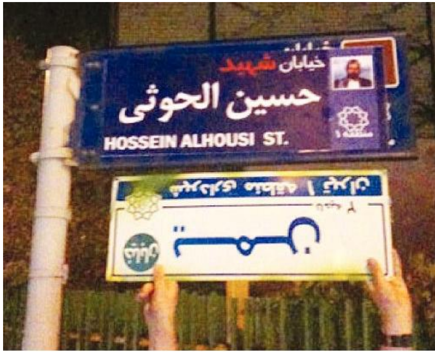
تغيير مسمى شارع في ايران من يمن الى حسين الحوثي