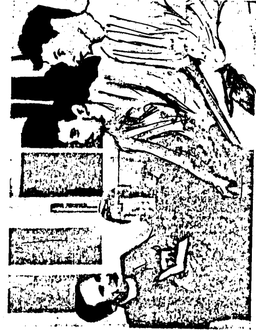
القس يعقد قرانها!

ولقد عقد القس زواج المشروطين من الرجال على الرجل وقدم موعودات كبيرة من اراد ان يتحول إلى امرأة او تتحول إلى رجل فيقول عن الماوسة والرعية التي يعكفها لمرض الإيدز منهم .