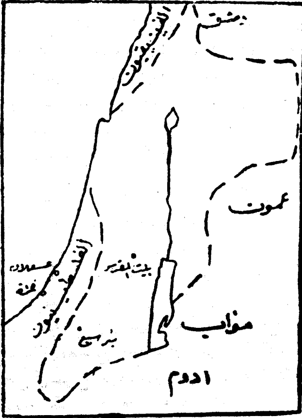
مملكة داود في أقصى اتساعها

وقبل أن ندع عهد داود الى عهد ابنه وخليفته سليمان نذكر أنه ينبغي ألا نبالغ في تقدير سعة ملك داود ، ونقتبس لذلك خريطة من J.W.D. Smith (١) توضح أقصى اتساع لمملكة داود :