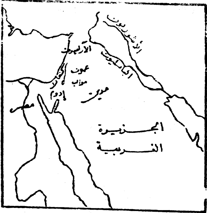
مناطق الساميين قديماً

وتدل الآثار البابلية على أن بابل كان لها السلطان على أرض كنعان في الألف الثالث قبل الميلاد ، وكانت حضارة الكنعانيين شديدة التأثير