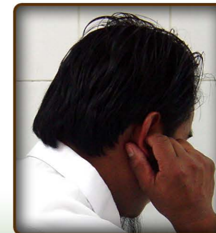
7 larawan ng paghaplos sa mga tainga.

9- Hahapusin ko nang isang beses ang mga tainga: ipapasok ko ang mga hintuturo sa butas ng aking mga tainga at ihahaplos ko naman ang hinlalaki sa likod nito. (tingnan ang larawan 7)