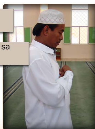
4 larawang patagilid ng paglagay ng mga kamay sa ibabaw ng dibdib.

4. Babasahin ko ang panalanging pambungad.