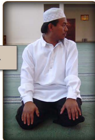
11 larawan ng Taslím sa kaliwa.