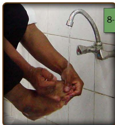
8- A larawan ng paghuhugas sa kanang-paa.

10- Huhugasan ko ang mga paa kasama ang bukung-bukong, nang tigtatatlong beses. (tingnan ang larawan 8- A at B)