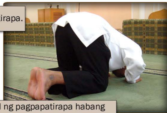
7 larawang patalikod ng pagpapatirapa habang nakatukod ang mga daliri ng paa.