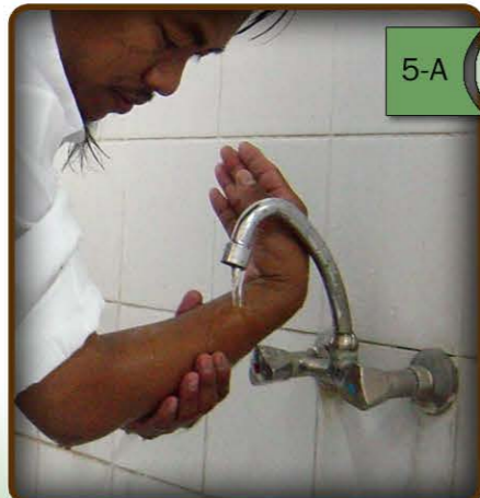
5-A larawan ng paghuhugas ng kanang-kamay.

7- Huhugasan ko ang mga kamay at braso kasama ang mga siko nang tigatatlong beses. (tingnan ang larawan 5- A at B)