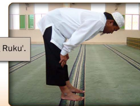
5 larawan ng pagsasagawa ng Ruku'.

Uulit-ulitin ko ito nang tatlong beses o higit pa. (Tingnan ang larawan 5)