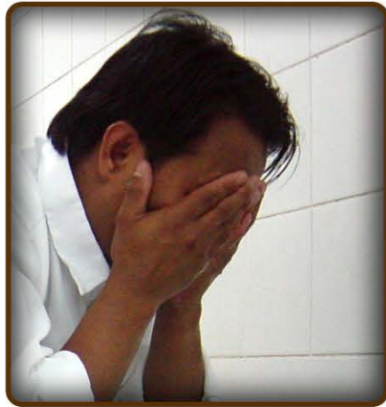
4 larawan ng paghuhugas ng mukha.

Huhugasan ko ang balbas at ilalim ng baba kung ito ay manipis at kung ito ay makapal ay huhugasan ko ang ibabaw nito at kukuskusin ko ito.