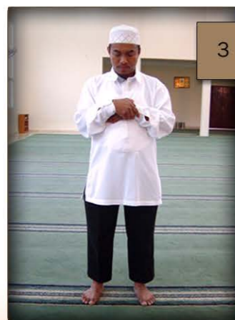
3 larawang paharap ng paglagay ng mga kamay sa ibabaw ng dibdib.

3. Ilalagay ko ang mga kamay sa ibabaw ng aking dibdib, ang kanan ay sa ibabaw ng kaliwa. (Tingnan ang larawan 4)