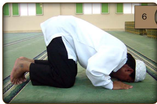
6 larawang patagilid ng pagpapatirapa.

"Luwalhatiin ang aking Panginoon ang Kataas-taasan " Uulit-ulitin ko ito nang tatlong beses o higit pa. (tingnan ang larawan 6 at 7)