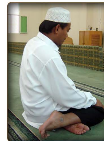
12 larawan ng Tawar-ruk.

Ang Tawar-ruk :ay ang itutukod ko ang aking kanang paa (sa sahig) na nakaharap sa Qiblah ang mga daliri ng paa, at ilalagay ko ang aking kaliwang paa sa ilalim ng kanang binti at ilalapat ko ang aking puwitan sa sahig. (tingnan ang larawan 12)