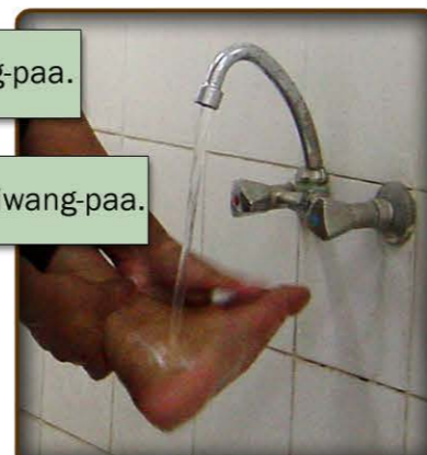
8- B larawan ng paghuhugas sa kaliwang-paa.