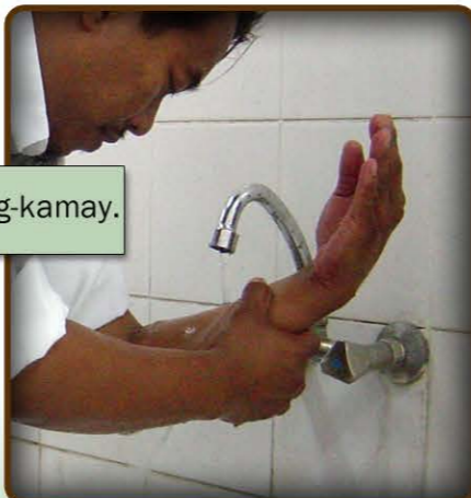
5-B larawan ng paghuhugas ng kaliwang-kamay.

8- Babasain ko ang aking mga kamay at ihahaplos sa ulo nang isang beses. (Hahapusin ko mula unahan ng ulo hanggang sa hulihan nito, pagkatapos ay ihahaplos ko rin ito pabalik). (tingnan ang larawan 6- A at B)