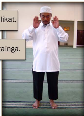
2 larawan ng pagtaas sa mga kamay pantay sa tainga.

3. Ilalagay ko ang mga kamay sa ibabaw ng aking dibdib, ang kanan ay sa ibabaw ng kaliwa. (Tingnan ang larawan 4)