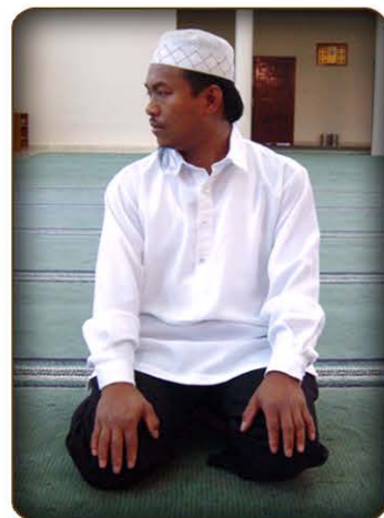
10 larawan ng Taslím sa kanan.

Para lumabas at tapusin ang Salah, kung ito'y dalawang Rak-ah. (tingnan ang larawan 10 at 11)