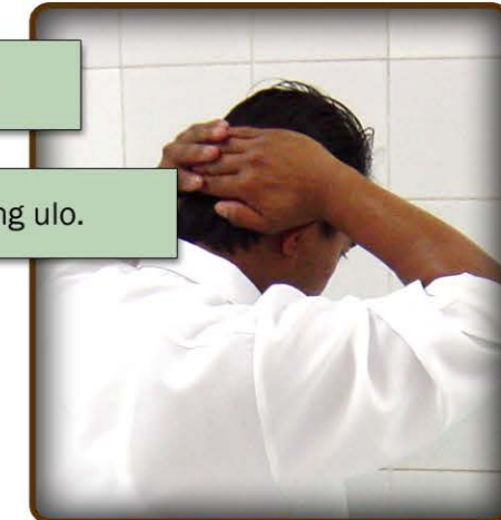
6-B larawan ng pagpunas sa hulihan ng ulo.

9- Hahapusin ko nang isang beses ang mga tainga: ipapasok ko ang mga hintuturo sa butas ng aking mga tainga at ihahaplos ko naman ang hinlalaki sa likod nito. (tingnan ang larawan 7)