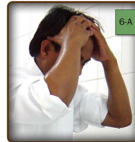
6-A larawan ng pagpunas sa unahan ng ulo.

8- Babasain ko ang aking mga kamay at ihahaplos sa ulo nang isang beses. (Hahapusin ko mula unahan ng ulo hanggang sa hulihan nito, pagkatapos ay ihahaplos ko rin ito pabalik). (tingnan ang larawan 6- A at B)